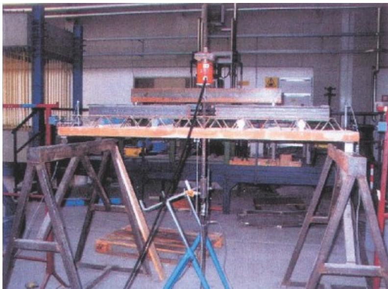
prova di carico

Nel calcolo dell'interasse delle strutture di banchinaggio è stato considerato oltre al peso proprio anche un sovraccarico accidentale pari a 100 kg/m 2 .